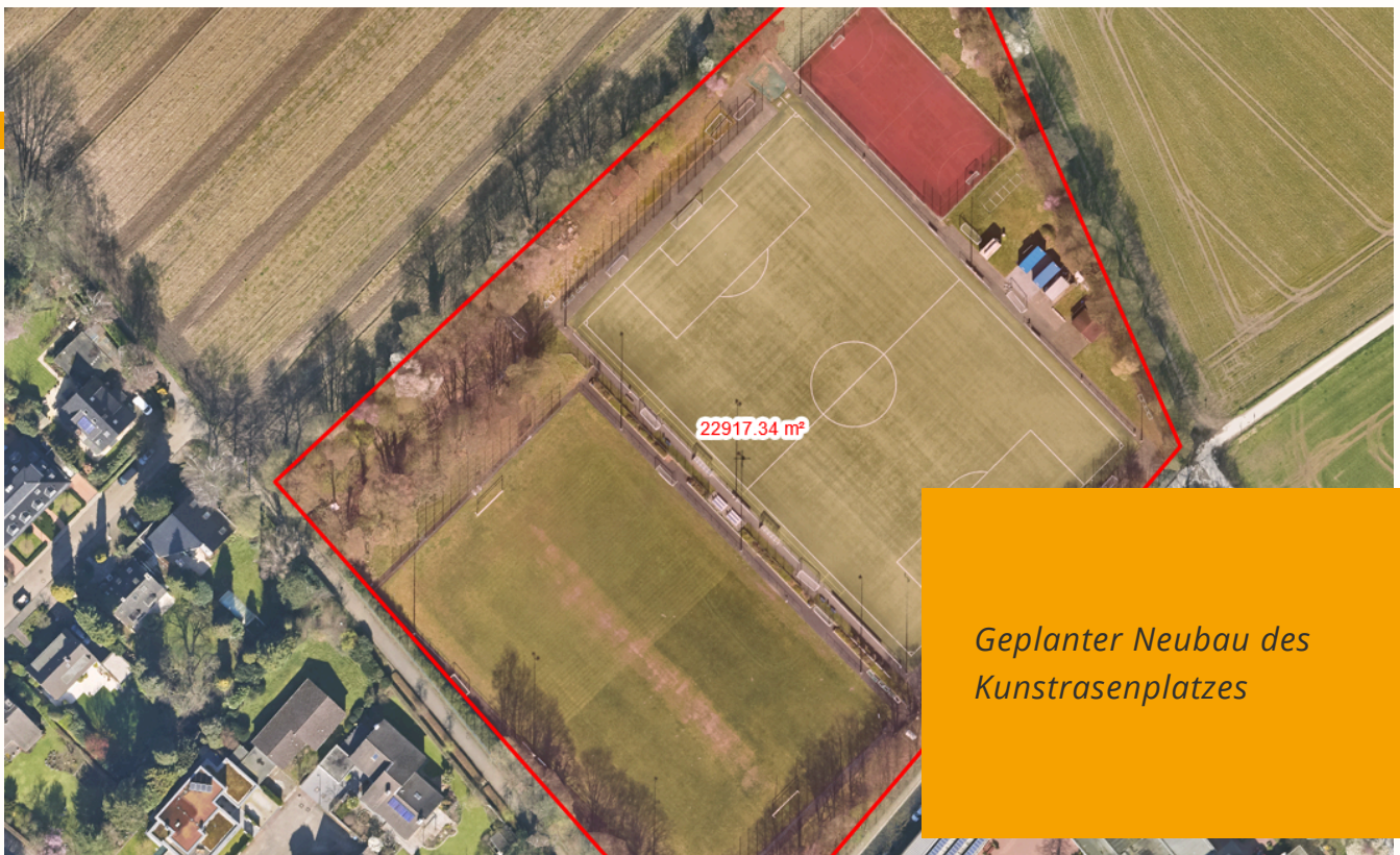
Geplanter Neubau des Kunstrasenplatzes

Das Gesamtorganigramm des Vereins wird überarbeitet und auf den neusten Stand gebracht.